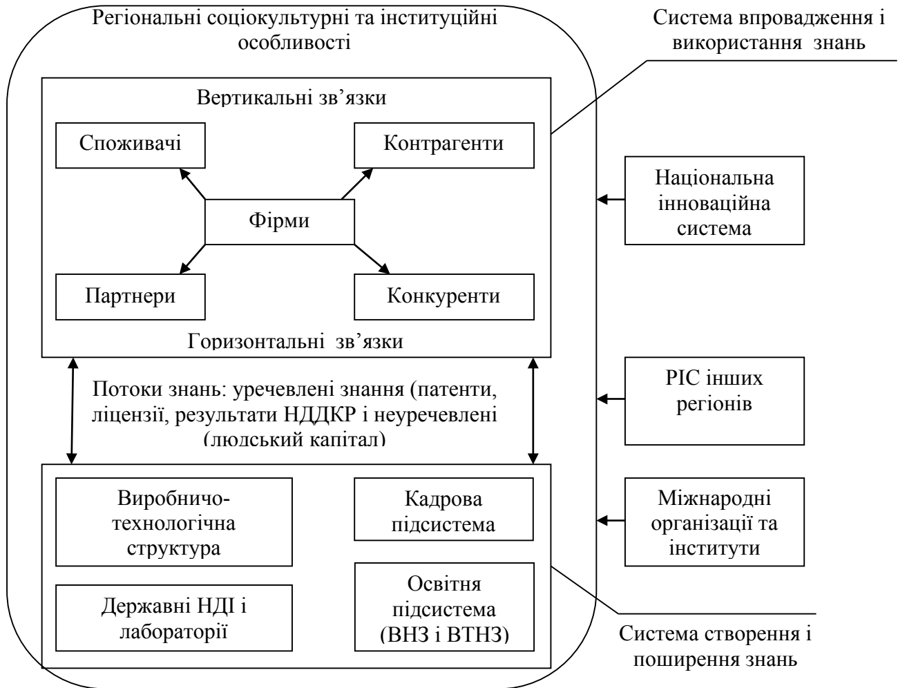
Рис. 2. Структура трансграничної єврорегіональної наноінноваційної системи (ТЄРНІС)

Обґрунтовано пріоритетні напрями підвищення конкурентоспроможності високотехнологічних транскордонних кластерів, такі як: дослідження можливостей використання спеціальних режимів співробітництва між комерційними та освітніми у сфері підготовки персоналу; розширення і поглиблення взаємодій між суб'єктами трансграничного кластера; створення виробничої інфраструктури, необхідної для функціонування малого і середнього наукомісткого бізнесу; створення спільних інноваційно-технологічних і маркетингово-логістичних центрів; удосконалення інституціонального середовища.