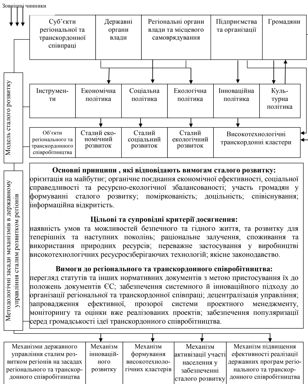
Рис. 4. Модель механізму управління сталим розвитком регіонів на засадах регіонального та транскордонного співробітництва

розвитку; підвищення ефективності реалізації державних програм регіонального і транскордонного співробітництва (рис. 4).