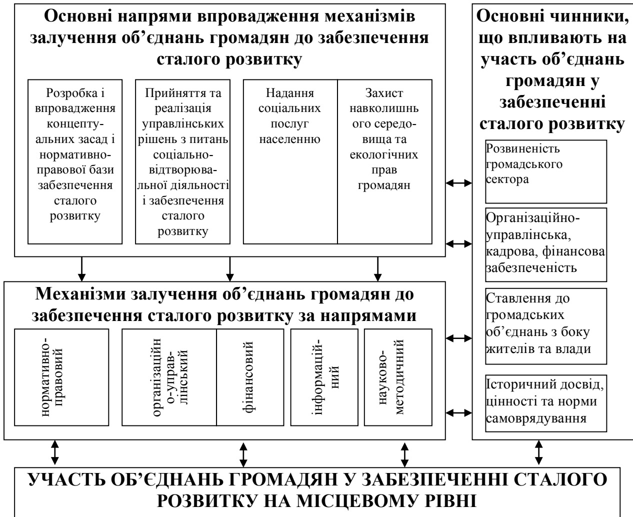
Рис. 3. Загальна структура механізму активізації участі об'єднань громадян у забезпеченні сталого розвитку на місцевому рівні

Щодо участі об'єднань громадян у прийнятті та реалізації управлінських рішень з питань соціально-відтворювальної діяльності, спрямованої на вирішення місцевих проблем і забезпечення сталого розвитку, то реалізація такого напрямку передбачає: розробку та реалізацію громадських або спільних із місцевими органами влади та бізнесом проектів, спрямованих на вирішення тих чи інших проблем місцевого розвитку (у тому числі на засадах соціального замовлення); проведення за участі об'єднань громадян моніторингу процесів розвитку територіальної громади (у тому числі моніторинг виконання стратегій, програм місцевого сталого розвитку), виявлення найбільш гострих проблем та спільний пошук шляхів їх вирішення; участь об'єднань громадян у прийнятті рішень щодо поточних питань життєдіяльності громади – землекористування, діяльності житлово-комунального господарства, якості та асортименту послуг, що надаються членам громади, соціального обслуговування громадян, що опинилися у складних життєвих обставинах, тощо; захист громадськими