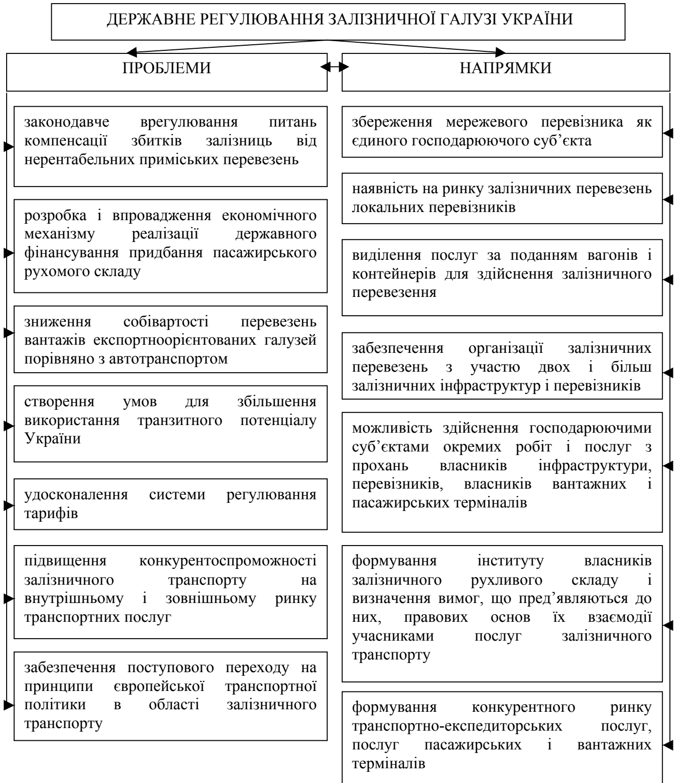
Рис. 1. Проблеми та напрями державного регулювання залізничної галузі України

та порівняти її з національними перебудовами у цій галузі, а також виокремити основні напрями державного регулювання залізничним транспортом України.