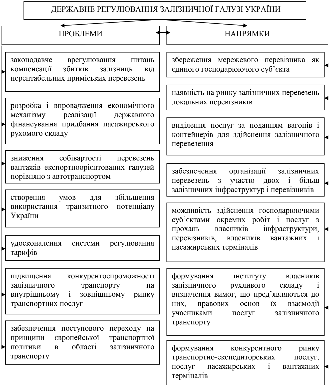
Рис. 1. Проблеми та напрями державного регулювання залізничної галузі України

та порівняти її з національними перебудовами у цій галузі, а також виокремити основні напрями державного регулювання залізничним транспортом України.