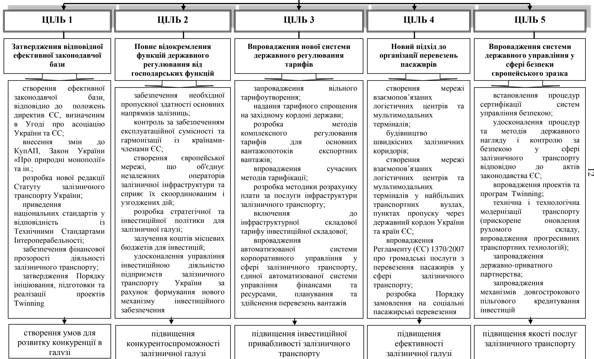
Рис. 3. Напрями удосконалення механізму державного управління розвитком залізничної галузі