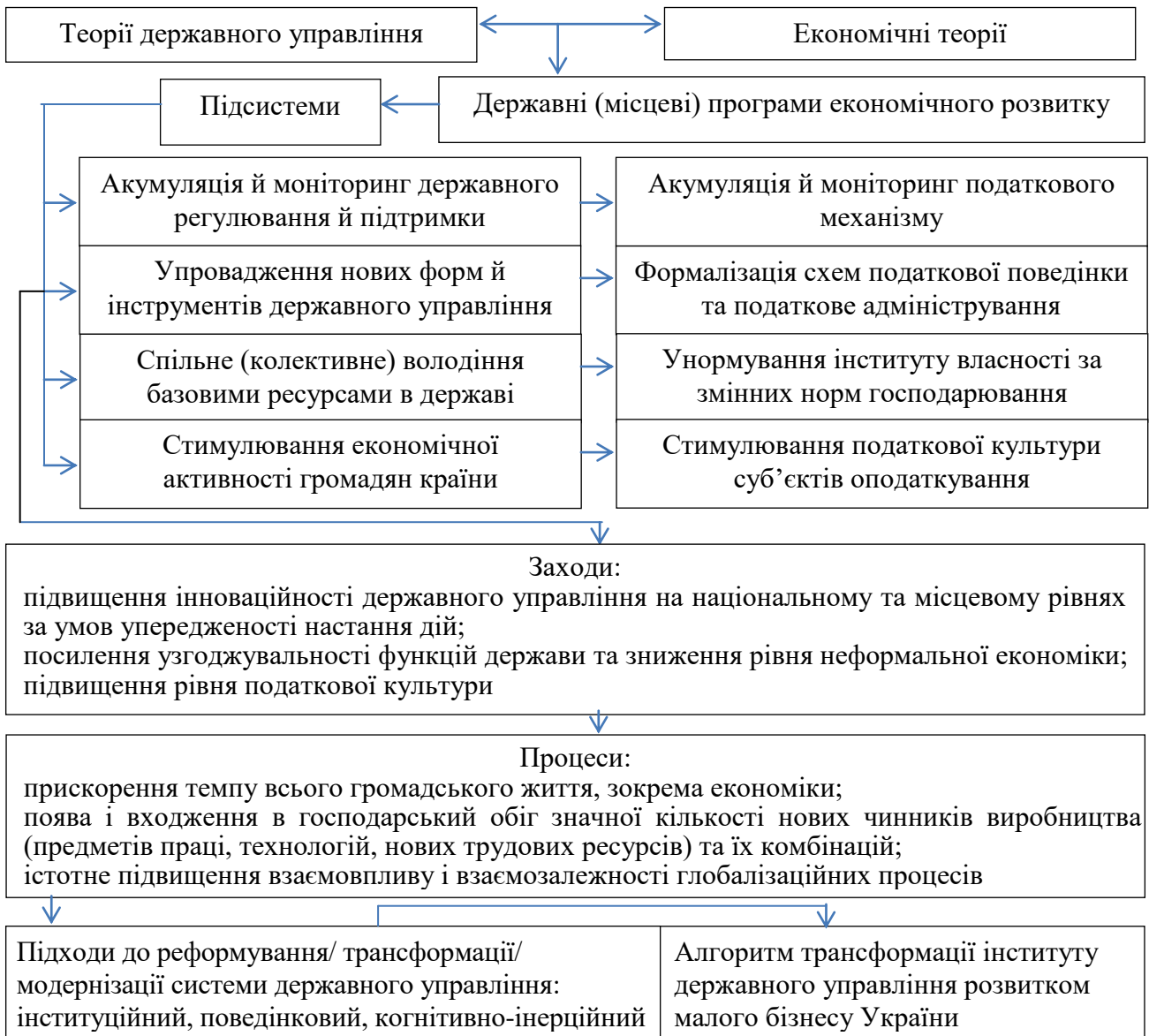
Рис. 2. Концептуальні засади функціонування податкового механізму державного регулювання розвитку малого бізнесу

Такими напрямками є дозвільна система; спрощення системи ліцензування й процедури створення та ліквідації підприємств; система нагляду; розробка заходів сприяння розвитку малого підприємництва; упровадження заходів щодо прискореного перегляду регуляторних актів органів місцевого самоврядування; форм та схем фінансово-кредитного забезпечення. На основі матеріалу розділу зроблено припущення, що за своєю сутністю існуючий податковий механізм державного регулювання розвитку малого бізнесу в Україні є задовільним і потребує науково-практичного опрацювання щодо пошуку форм та методів удосконалення.