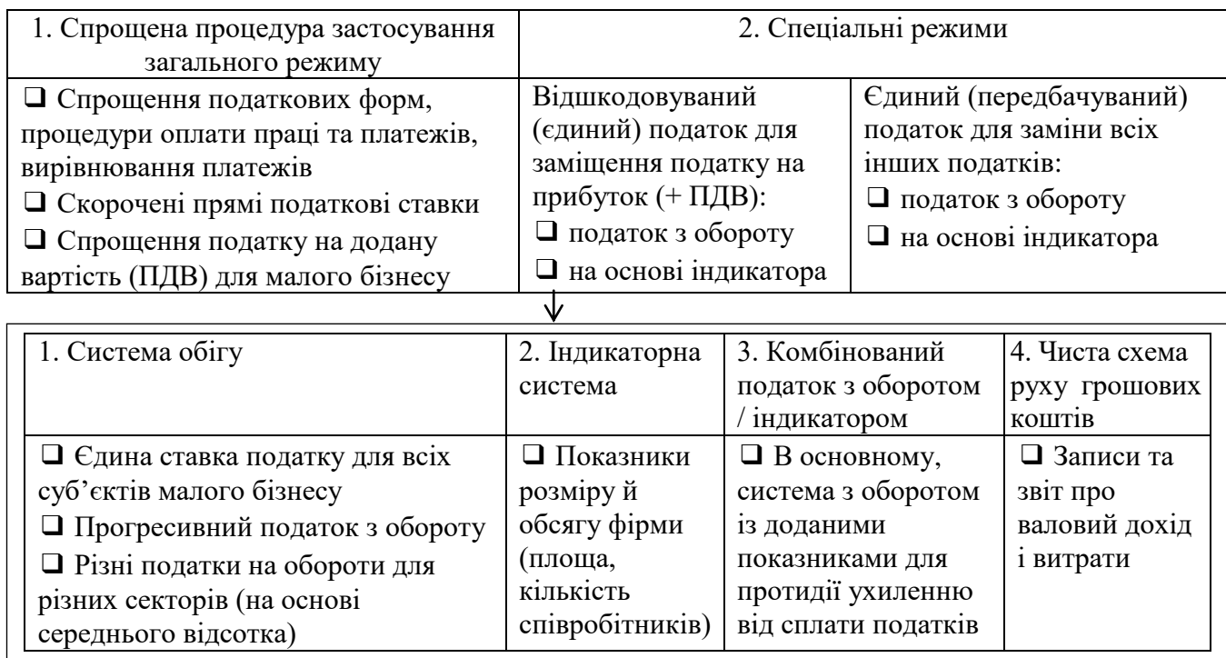
Рис. 1. Логіка системи оподаткування малого бізнесу, за якою відбувається реформа для заохочення його формальності та сталого зростання

Відзначаючи механізм як засіб реалізації податкової політики та складову державної регуляторної політики, особливостями податкового механізму державного регулювання розвитку малого бізнесу в Україні визнано податкове адміністрування та податковий менеджмент. Характеризуючи державне регулювання й державну підтримку як елементи державного управління, сформульовано існування двох напрямів реалізації податкового механізму: регулювання й підтримка. Це дозволило дати визначення категорії «механізм державного регулювання» за двома класифікаційними ознаками (як процесу та за суб'єктно-об'єктною складовою) та зафіксувати відсутність моніторингу результативності податкової політики. За результатами систематизації наукових підходів до визначення податкового механізму, з'ясовано такі його складові, як «податкова культура» та «податковий клімат», значущість яких в умовах сталого реформування податкового законодавства наразі знижується. Результати узагальнення специфіки податкового механізму державного регулювання розвитку малого бізнесу в Україні дозволили визначити логіку системи оподаткування малого бізнесу, за якою відбувається реформа, для заохочення його формальності та сталого зростання (рис. 1).