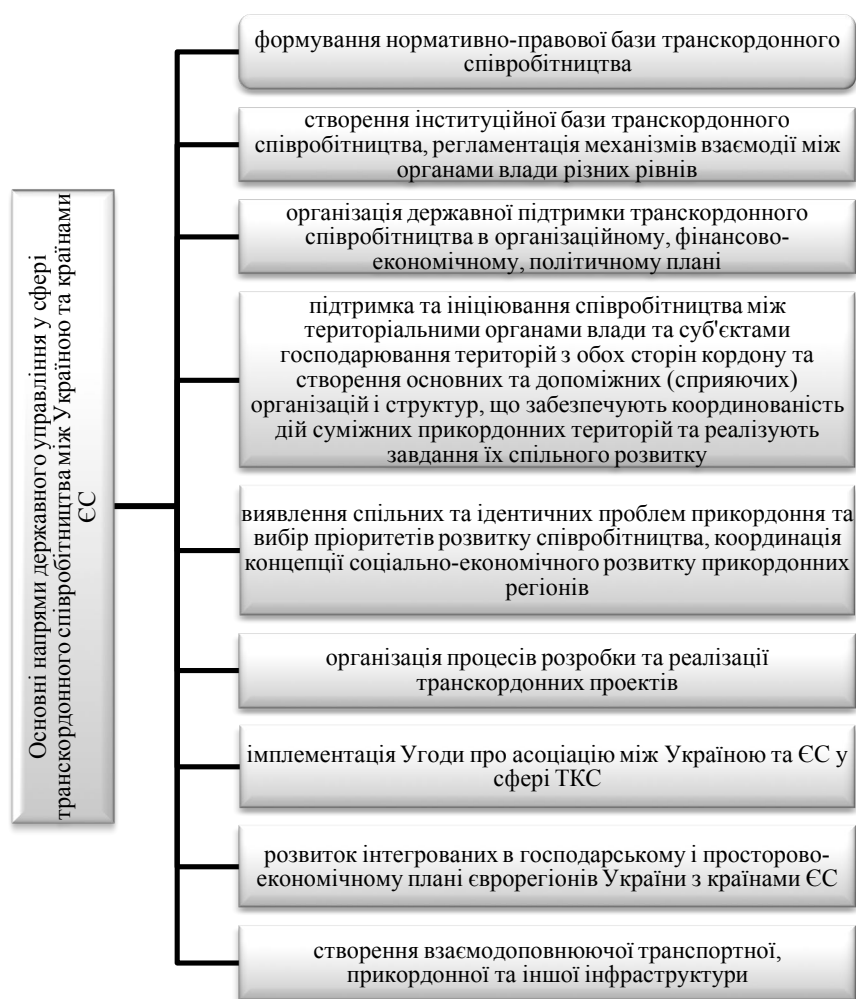
Рис.1. Основні напрями державного управління у сфері транскордонного співробітництва між Україною та країнами ЄС

Основні напрями державного управління у сфері транскордонного співробітництва між Україною та країнами ЄС представлені на рис. 1.