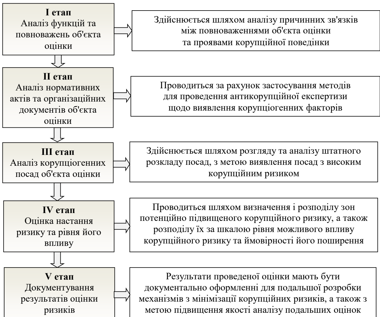
Рис. 4. Алгоритм механізму оцінювання корупційних ризиків

Розроблено та запропоновано власний механізм оцінки корупційних ризиків шляхом упровадження його відповідного алгоритму, що на практиці надасть можливість більш ефективно і якісно визначати рівень корупційного ризику, з метою подальшого обрання заходів для його мінімізації (рис. 4).