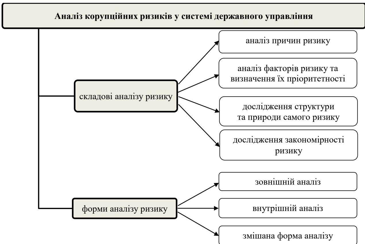
Рис. 3. Елементи аналізу корупційних ризиків у системі державного управління України

Доведено, що під час аналізу корупційних ризиків повинно проводитися пізнання і дослідження його складових частин – причин, умов і факторів ризику, а також виявлення природи самого ризику та закономірностей його прояву. Уточнено зміст аналізу корупційного ризику в системі державного управління, що дозволить отримати необхідну інформацію про його сутність і структуру та надасть можливість закінчити ідентифікацію ризику (рис. 3).