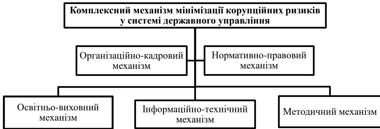
Рис. 5. Комплексний механізм мінімізації корупційних ризиків у системі державного управління України

Надано пропозиції, щодо суті та змісту ключових чинників комплексного механізму мінімізації корупційних ризиків у системі державного управління.